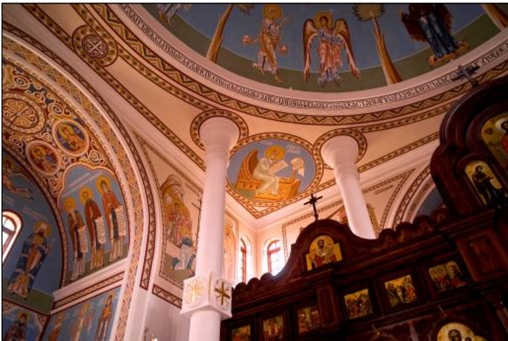
Илл. 9 - 10. На плоском потолке основного объема, расположены четыре медальона с изображением евангелистов.