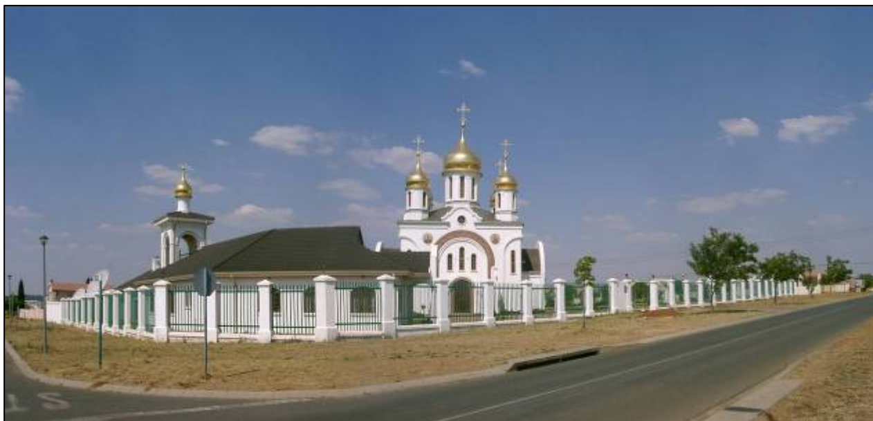
Илл. 1. Панорама храма преп. Сергия Радонежского.

Живописный силуэт православного храма во имя преп. Сергия Радонежского виден издалека, уже с главной автострады, пересекающей Южную Африку (илл. 1 – 4).