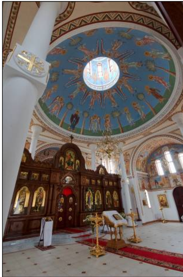
Илл. 5 - 6. Фрагменты внутреннего убранства храма преп. Сергия Радонежского до росписи и после росписи.

Роспись выполнена в Русско-Византийской стилистике живописи храмов XII века. Стилистический диапазон живописи этого времени достаточно широк для того, чтобы выбрать наиболее подходящее решение для оформления современного храма.