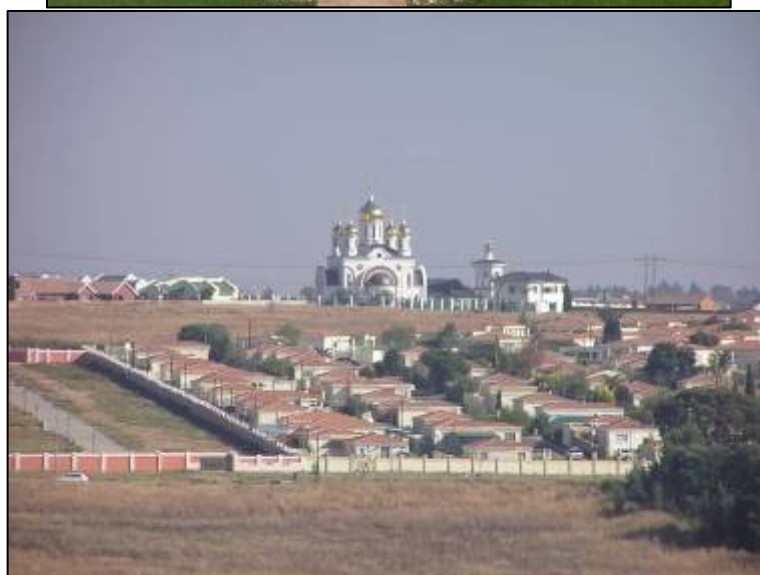
Илл. 2 - 4. Виды фасадов храма преп. Сергия Радонежского.