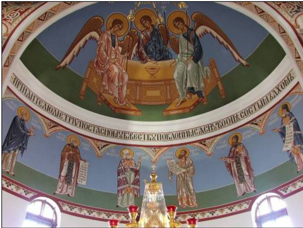
Илл. 11. Главное изображение алтаря – образ Пресвятой Троицы, ниже и по сторонам располагаются изображения избранных святых.

Главное изображение алтаря – образ Пресвятой Троицы. Он располагается в конхе алтарной апсиды, а ниже и по сторонам располагаются изображения избранных святых (илл. 11).