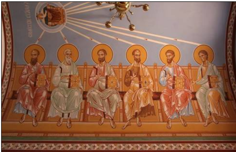
Илл. 14. Живопись свода хоров занимает сцена Сошествия Св. Духа на Апостолов.

Живопись свода хоров занимает сцена Сошествия Св. Духа на Апостолов, а также изображения св. Гимнографов и Псалмопевцев (западная стена хоров) (илл. 14).