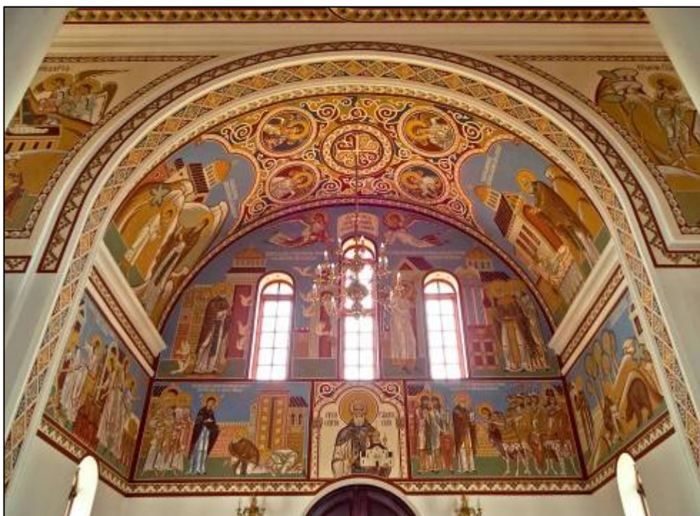
Илл. 12. Роспись южного рукава посвящена житию преп. Сергия Радонежского.

Роспись северного рукава представляет собой образ Тысячелетия русской святости, где изображения святых Древней Руси соседствует с образами новомучеников и исповедников XX-го столетия (илл. 13).