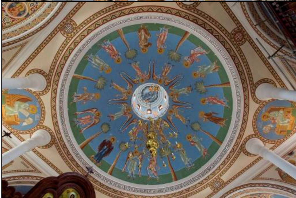
Илл. 7 – 8. Верхние регистры храма (барабан и чаша купола) занимает сцена «Вознесение Господне».