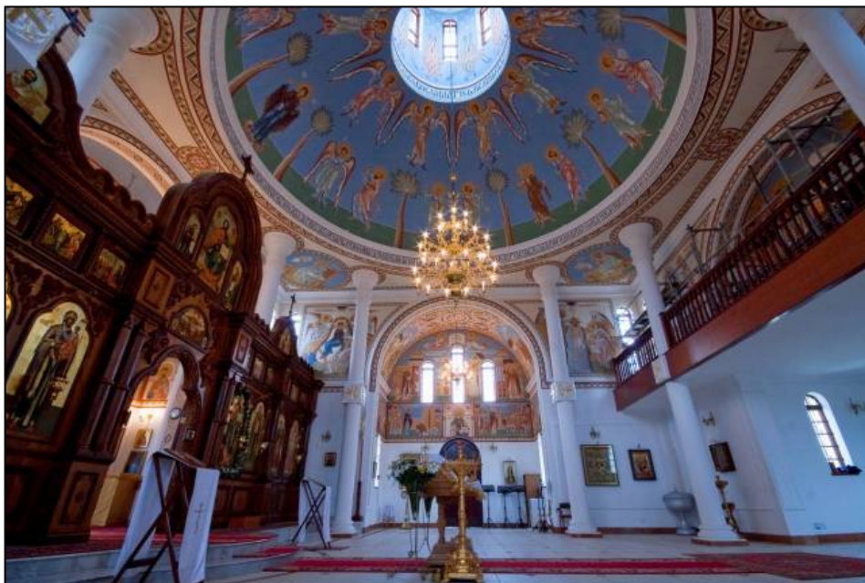
Илл. 15. Общий вид интерьера храма преп. Сергия Радонежского после росписи.

Площадь росписи составила приблизительно 900 кв. м.