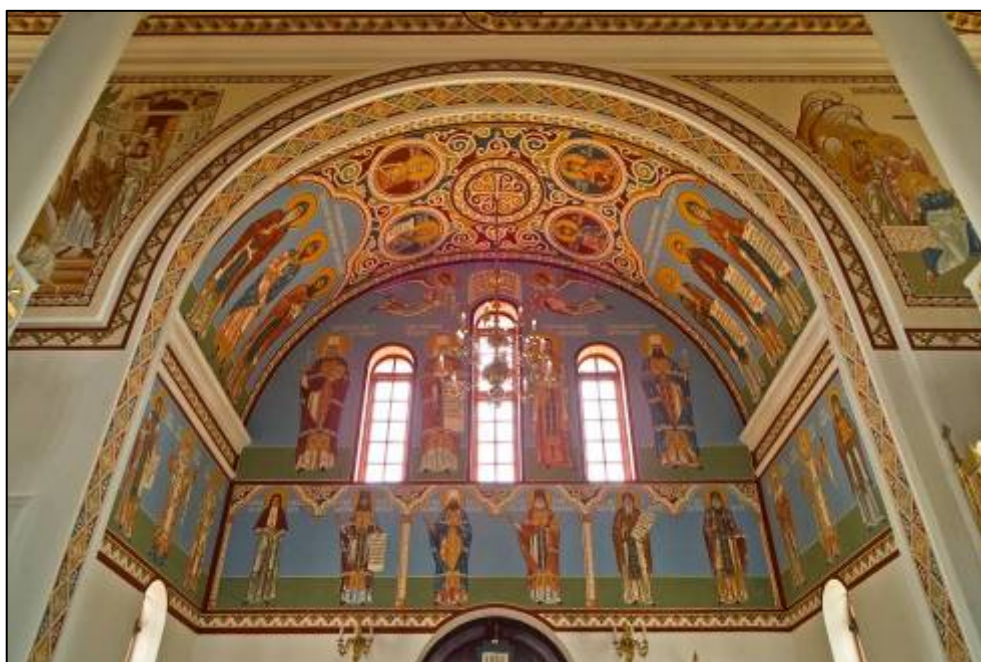
Илл. 13. Роспись северного рукава представляет собой образ Тысячелетия русской святости, где изображения святых древней Руси соседствует с образами новомучеников и исповедников XX-го столетия.

Роспись северного рукава представляет собой образ Тысячелетия русской святости, где изображения святых Древней Руси соседствует с образами новомучеников и исповедников XX-го столетия (илл. 13).